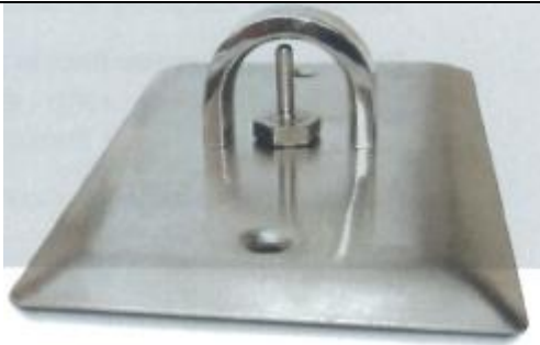
Sensor de temperatura de aire