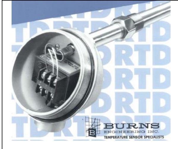
Termómetros de resistencia serie WSO y WPP