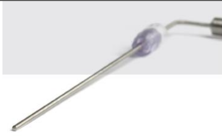
Sensores de temperatura para bio reactor